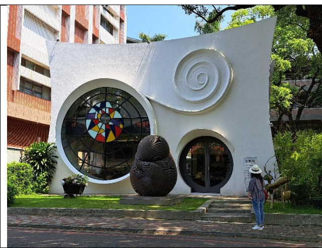
小興苑文化藝術館