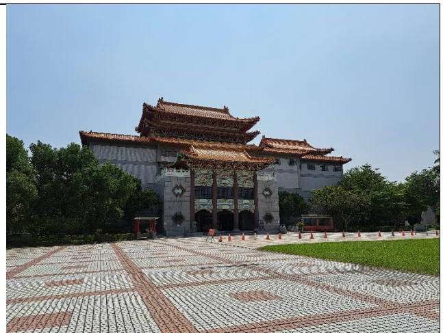
國史館臺灣文獻館