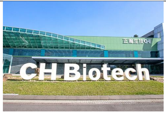
正瀚生技股份有限公司