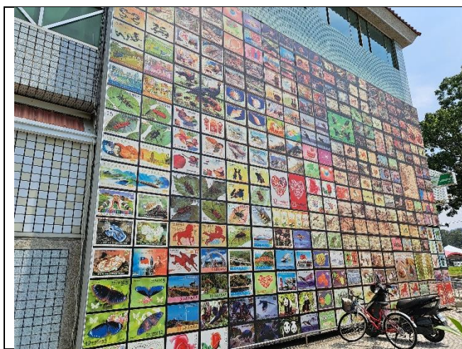
中興新村郵局郵票牆